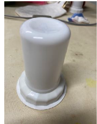
Lampje van de action

Knip uit een vel papier een model wat je als huisje wilt gebruiken. Eventuele raampjes e.d. kan je erop tekenen. Leg het vel papier op je dikke naaldvilt en knip gaten eruit voor ramen en deur. Versier het stuk vilt naar eigen inzicht. Naai of lijm de kopse kanten aan elkaar vast zodat je een mooi rond huisje krijgt. Het lampje van de action erin plaatsen en het geheel op een schotel of stukje karton zetten.